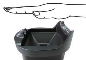
静脈認証タイムレコーダー

地場配送、複数配送、長距離運行、車両の乗り換え、同乗者など、様々なデジタコデータを自動判別し勤怠データを作成します。運輸業に特化した勤怠システムです。